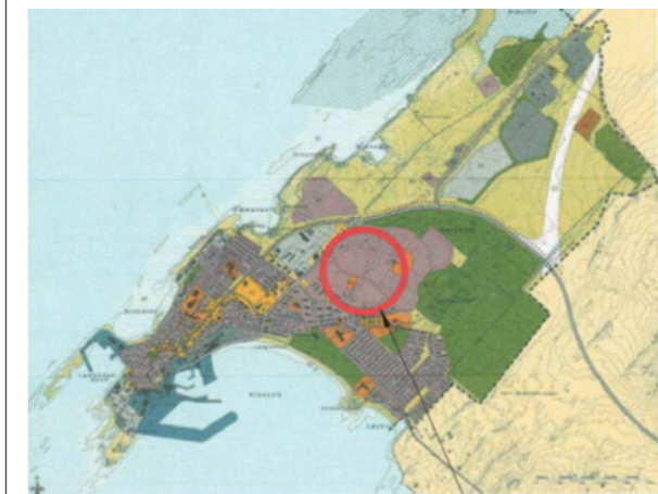
Yfirlitsmynd Akranes Skipulagssvæði